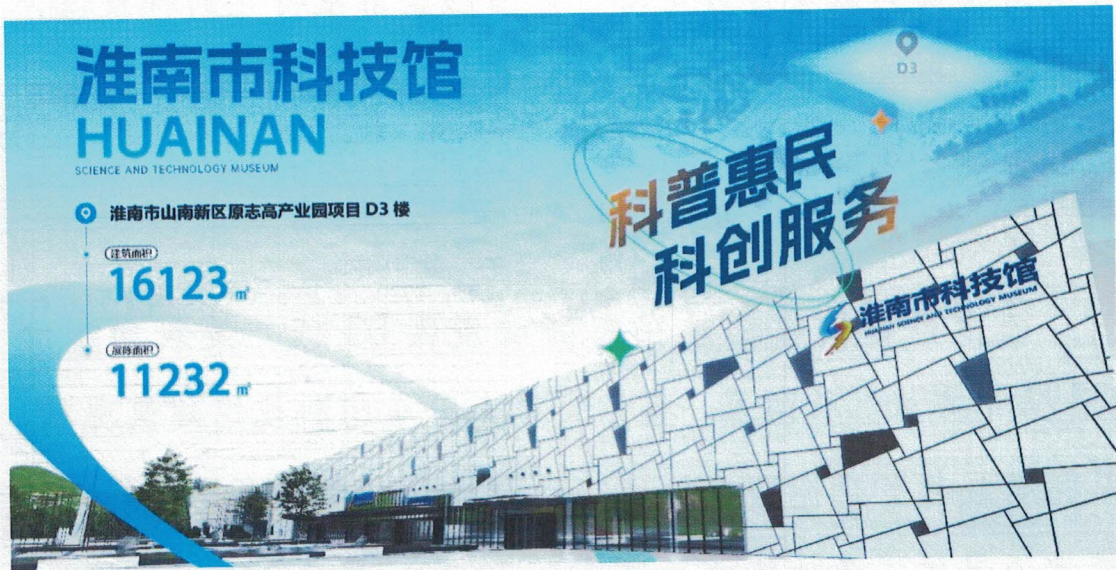
建筑外立面效果图